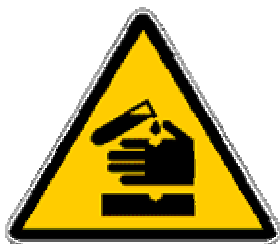
Simbolo del rischio chimico