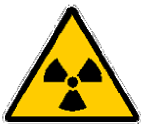
Simbolo del rischio radiologico

I locali all’interno dei quali possono essere presenti fonti artificiali di radiazioni sono contrassegnati con il seguente segnale: