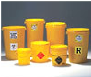
Contenitori di rifiuti sanitari pericolosi a rischio infettivo