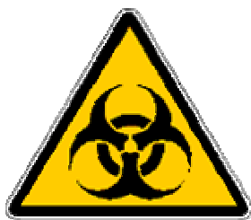
simbolo del rischio biologico