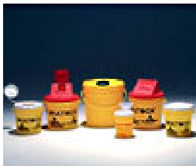
Contenitore di rifiuti sanitari pericolosi a rischio infettivo