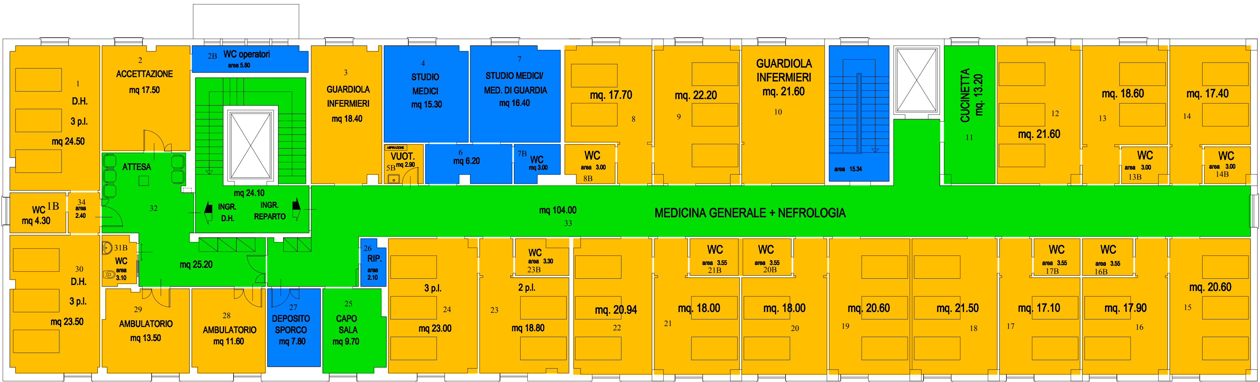
PADIGLIONE "F" - PIANO TERZO